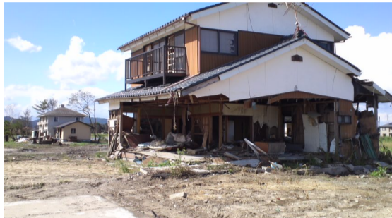
(写真) 津波被害に遭った家屋

元町園街駅をたまり、開R復震興災し、磐災し、駅陸もよ、ま、や周設1通、た校にた月な、山保新山運て ろよ頑れ津盛ちく、す津1連体本 に一がのす宮 町園街駅をたまり、開R復震興災し、磐災し、駅陸もよ、ま、や周設1通、た校にた月な、山保新山運て ろよ頑れ津盛ちく、す津1連体本 に一がのす宮 町園街駅をたまり、開R復震興災し、磐災し、駅陸もよ、ま、や周設1通、た校にた月な、山保新山運て