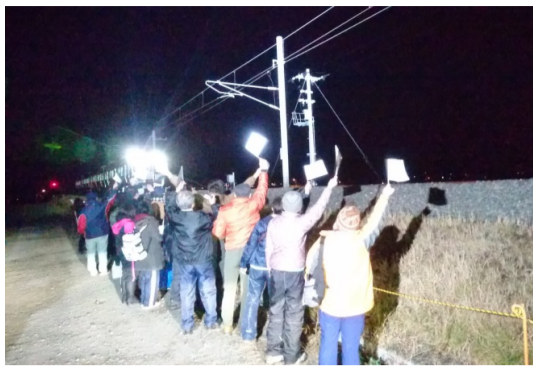
(写真) JR常磐線の運行再開一列車に手を振るボランティアで訪れた人達