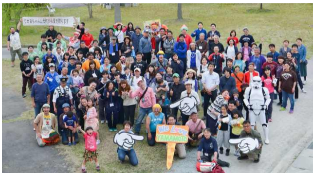
(写真) 町民、ボランティア達の運営スタッフ陣

で認にりきる大 れてよ波げメはにめ遭るで た命よ すし避、な2震ま縦うをし！全作、つな校以。がり、 て難学地日災たし長海受、ト体ら1てど庭前 救、 い計校震前が、たににけ校ルをれ9いのがか わ9 た画ががに発東。建向流舎か1た8た被浸ら れ0 そを事あも生日 てかせはさ・学9た害水高 ま名 う確前 大す本 らつる津上5校年 にす潮 しの