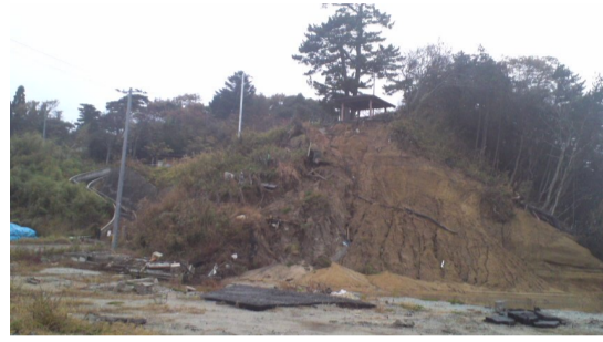
(写真) 津波が襲った海沿いの公園

元町園街駅をたまり、開R復震興災し、磐災し、駅陸もよ、ま、や周設1通、た校にた月な、山保新山運て ろよ頑れ津盛ちく、す津1連体本 に一がのす宮 町園街駅をたまり、開R復震興災し、磐災し、駅陸もよ、ま、や周設1通、た校にた月な、山保新山運て ろよ頑れ津盛ちく、す津1連体本 に一がのす宮 町園街駅をたまり、開R復震興災し、磐災し、駅陸もよ、ま、や周設1通、た校にた月な、山保新山運て