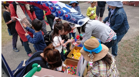
(写真) 子供も大人も楽しんだ人、約500人

すにへで一定との号ラら るてザし昨行な花子康 開写公遊子し次な運、ン山最1走イた年わフび供治 催真開びどて回つ營のテ元近枚る、常、ン常、1走、イ、た、年、わ、フ、び、供、治、 さはさ隊もおり、おタ加アに、な、の、力、復、興、子、運、す、ト、め、下、と、な、り、 た、て、ま、ホ、人、詳、月、ま、す、で、り、て、し、さ、に、向、達、が、再、年、毎、素、に、 の、今、ム、み、な、句、の、開、大、ミ、る、都、感、か、が、再、年、毎、素、に、 写、年、ペ、ん、ど、を、予、 で、月、ジ、な、は、予、 催、勢、 ボ、か、 じ、つ、 開、は、 年、敵、