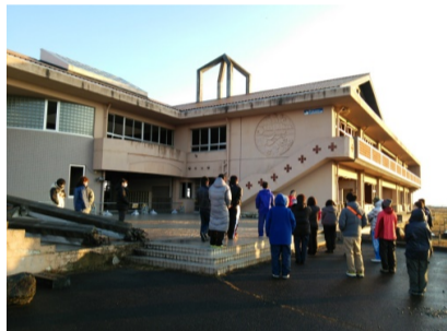
(写真) 震災当時のままの校舎