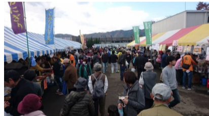
(写真) 昨年の産業祭の様子