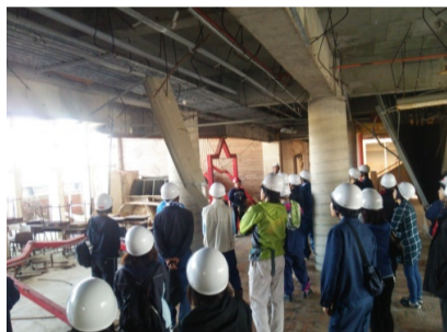
(写真) 校舎内も震災当時のまま