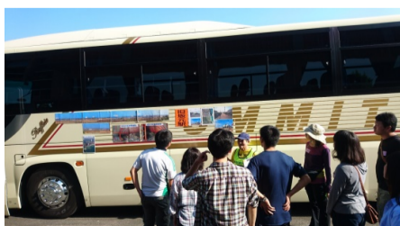
(写真) アミー号の活動風景

※お車で移動される場合は、適度な休憩をとりましょう。 ※「山元南スマートインター」はETC車専用です。