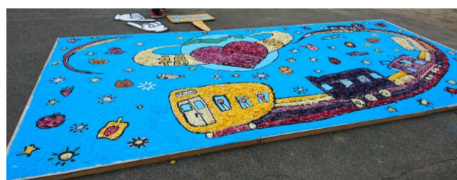
(写真) 子供たちと作りあげるフラワーアート