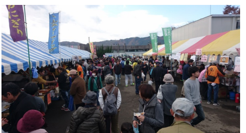
昨年の産業祭の様子