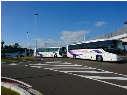
坂元駅に到着したツアーバス

のて元へ盤、葉な参ス方へてのを霊一14常(アツ五 質一町向、約も場加毎が移そその受塔は、の行時名警約1日九月 問山にか語1聞所者か待動、い名受け、の、行間が線4日(月)二 も元通り時かがか説機、の、ま前、刻、山、旧、語、か、0目た客約8の あ町う途部間れあら明し旧、た、ま、れ、山、下、部、て、元、名)大に訪00日 つにボ中さのまるはをて中行。また、語、下、部、へ、ア、に、午、光、サ、マ、語、山、元、町、二 た通ラでん語した。だ、い、ま、着、語、し、り、小、部、学 そう魅テ、降部。な、こ、の、し、り、小、部、学 う力イ約車ア、な、の、よ、う、の、パ す。に年、場、の、し、山