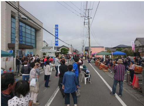
人が溢れかえる商店街通り。