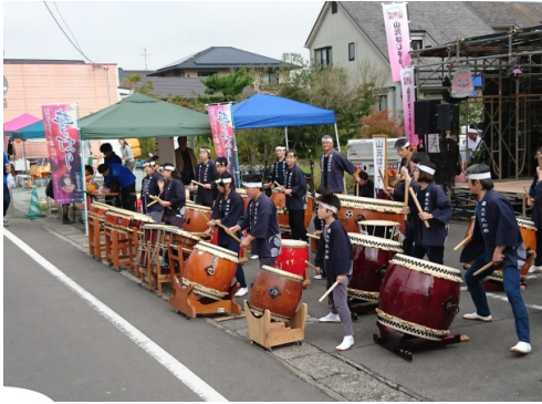
地元の太鼓集団の演奏でスタート。