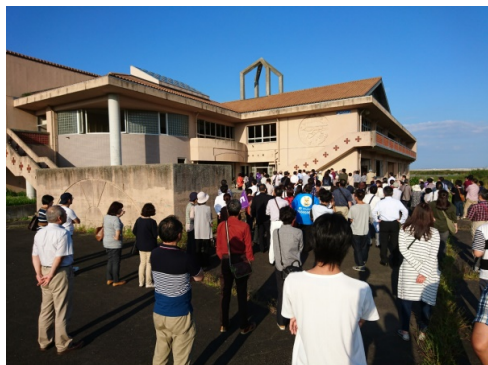
旧中浜小に多くの方が訪れました。

度0分、来てみてくださ、い外、く、見、だ 度0分、来てみてくださ、い外、く、見、だ 度0分、来てみてくださ、い外、く、見、だ